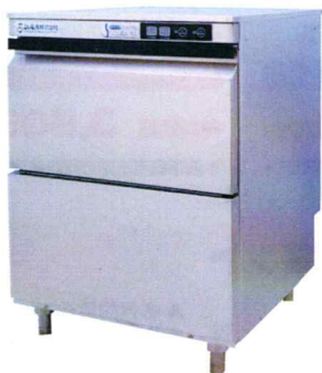
アンダーカウンター食器洗浄機 DJWE-400F(100V) 特別価格 360,000円(税別)