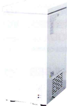
冷凍ストッカー 60-OR 特別価格 24,000円(税別)

業務用食器洗浄機 冷凍ストッカー 業務用厨房機器の販売、 設置取付工事も承ります。 お気軽にご相談ください。